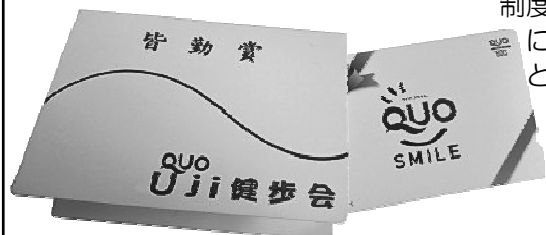
皆勤賞(QUOカード 500円)、精勤賞(QUOカード 300円)