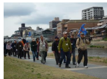
京都御苑を目指して鴨川河畔を北上