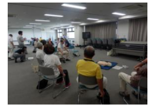
グループに分かれて実習