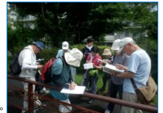
木幡コース下見の様子